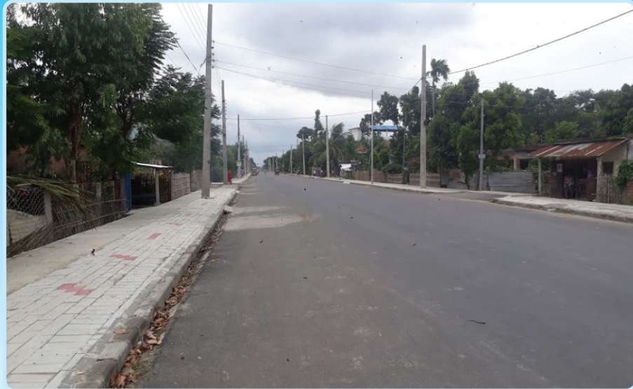
इनरूवा ३ मा निर्माणाधीन सडक