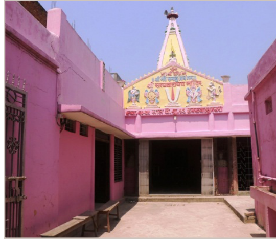
सत्यनारायण मन्दिर इनरूवा ९