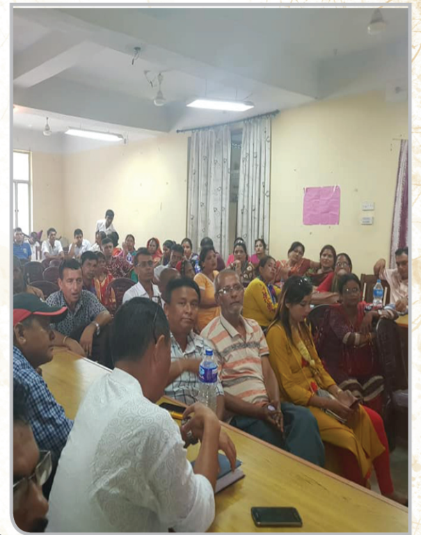
तेस्रो नगर सभा