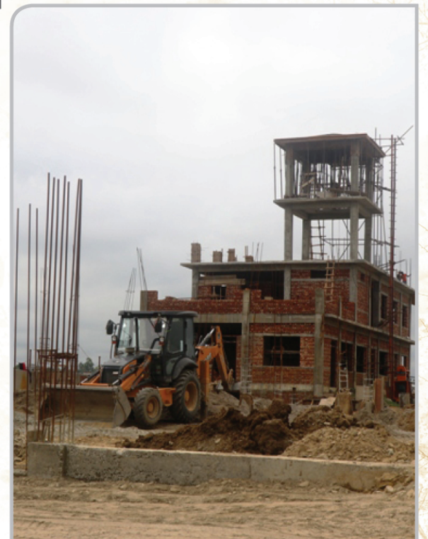
नयाँ बसपार्क निर्माण इनरुवा ४