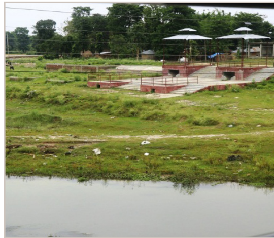
स्वर्गद्वारी घाट इनरूवा ४