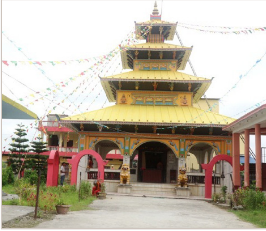
रामजानकी मन्दिर इनरूवा ४