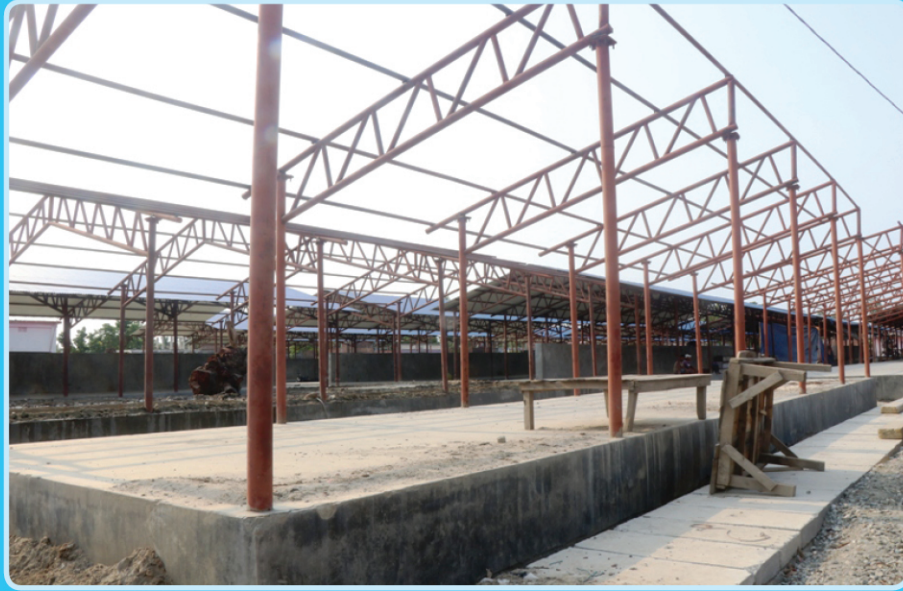
इनरूवा २ स्थित बिहीबारे हटिया निर्माण