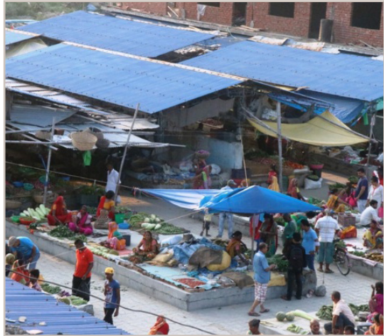
विहिबारे हटिया इनरूवा ९