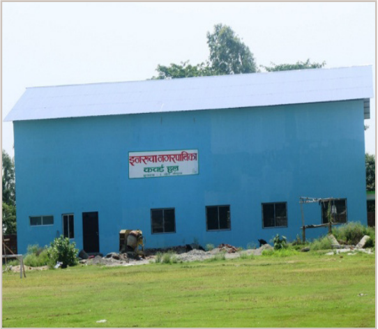
खेल मैदान, कभर्ड हल इनरूवा ९