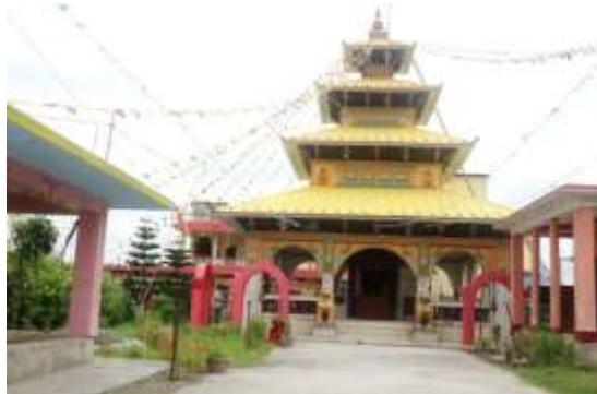
रामजानकी मन्दिर, इनरुवा ४