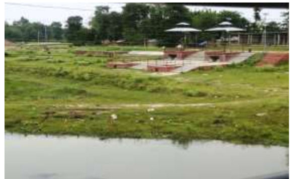
स्वर्गद्वारी घाट, इनरुवा ४

नगर सभाको तेह्रौँ अधिवेशनबाट स्वीकृत आर्थिक वर्ष २०८१/०८२ को वार्षिक नीति, कार्यक्रम तथा बजेट