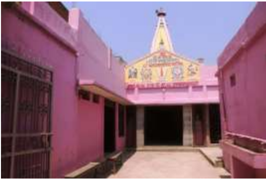
सत्यनारायण मन्दिर, इनरुवा १

धार्मिक तथा पर्यटकीय दृष्टिकोणले इनरुवा नगरपालिका निकै महत्व पूर्ण रहेको छ । यस क्षेत्रमा विभिन्न मठ मन्दिर, मस्जिद तथा थानहरू रहेका छन् । साथै पर्यटकीय सम्भावना भएका क्षेत्रहरूलाई सम्बर्दन तथा प्रचारप्रसार गर्न सके पर्यटन प्रवर्दन गरि आन्तरिक श्रोत वृद्धि गर्न सकिन्छ । यस क्षेत्रका प्रमुख मठ मन्दिर, मस्जिद तथा पर्यटकीय सम्भावना भएका क्षेत्रहरू निम्नानुसार रहेका छन् ।